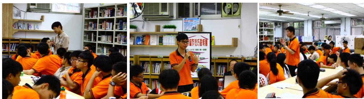
反應熱烈，同學踴躍舉手發言！