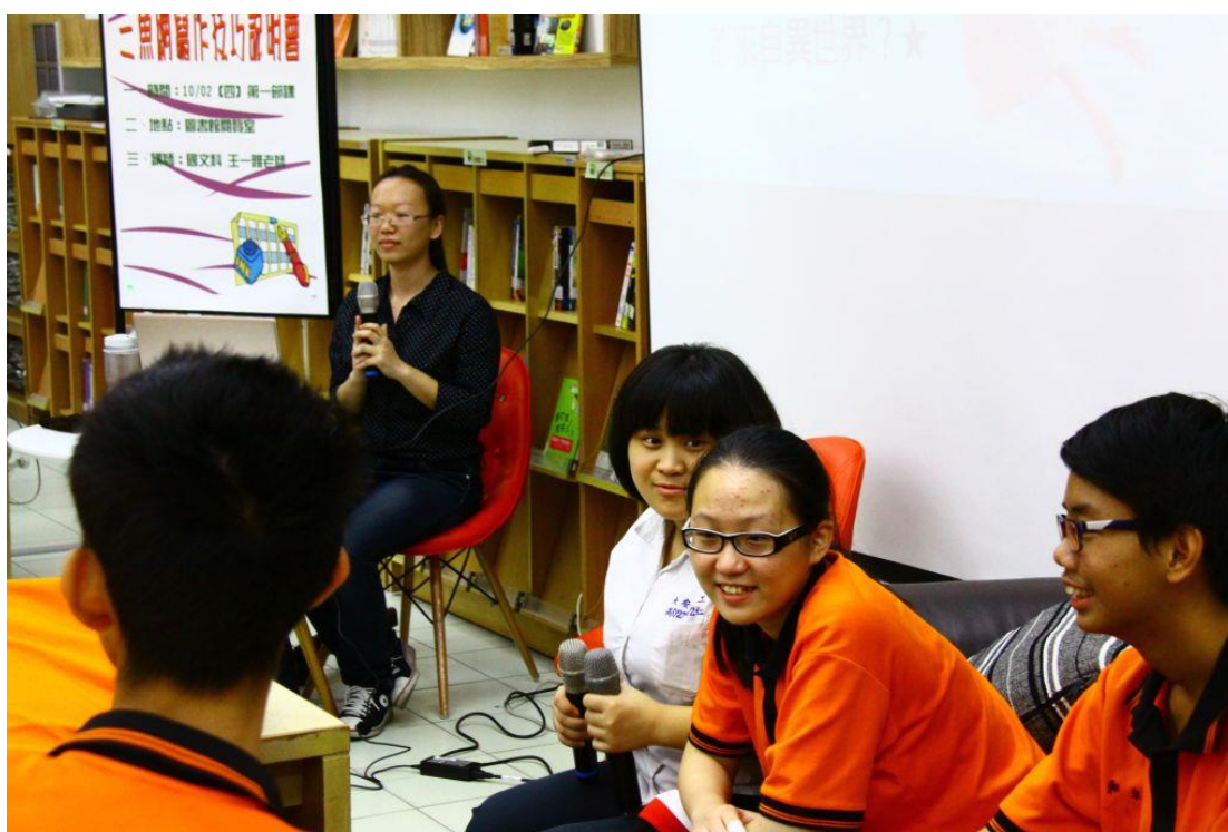
三位代言人同學參加對談，氣氛輕鬆～