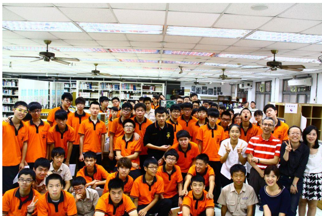
活動人數爆滿，拍個大合照吧～