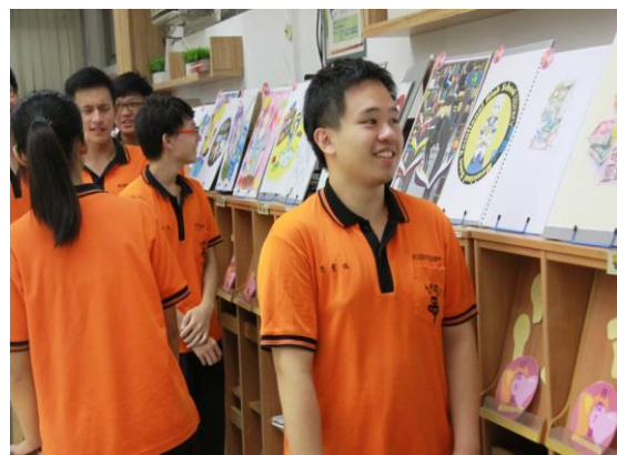
認真評比，選出自己的最愛