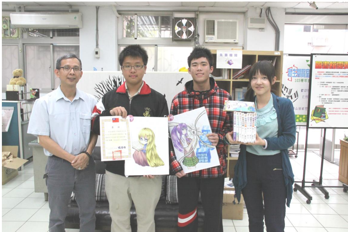
得獎同學與活動主辦老師合影