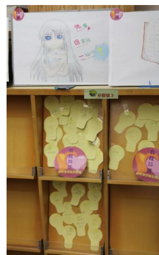
票選結果出爐～最終得獎作品&滿滿的投票留言支持