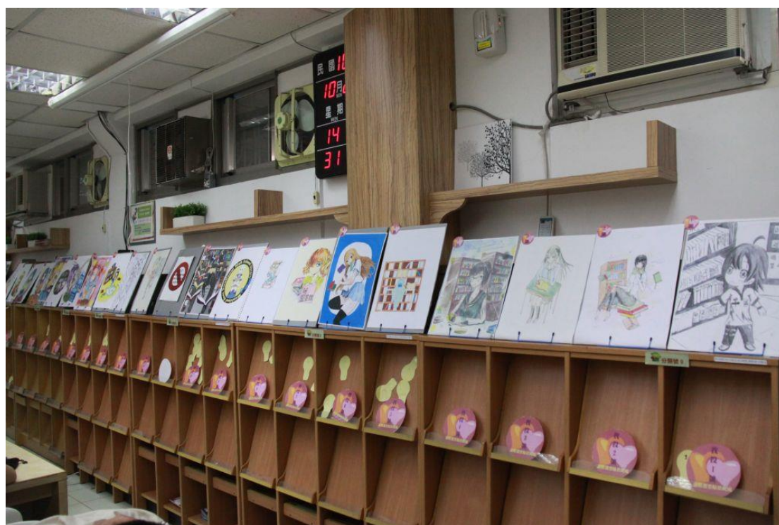
30 篇投稿作品一字排開，下方為投票區