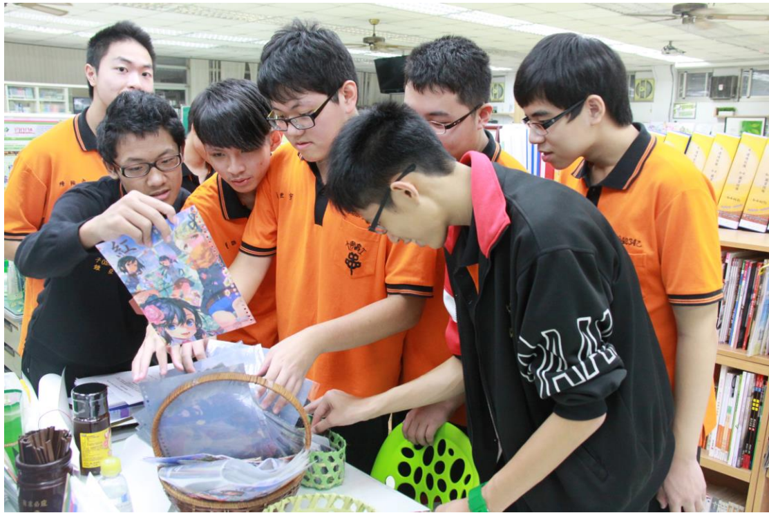
參加活動，領好康贈品～