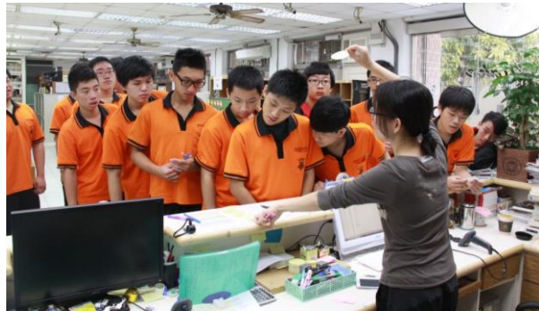
同學「揪團」參加票選活動，排隊領票～