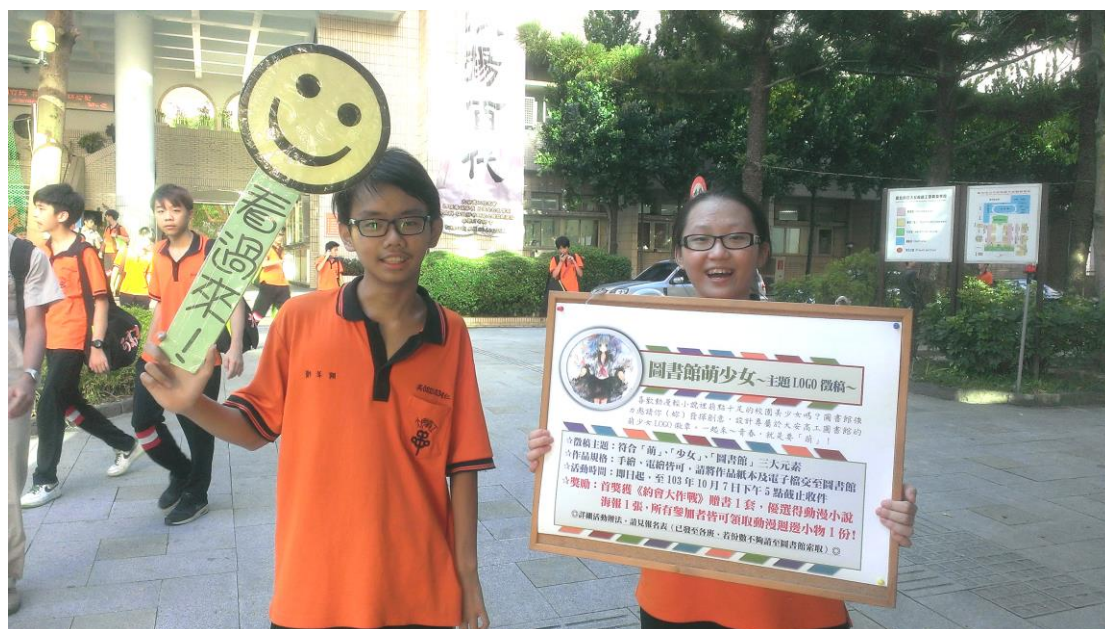
閱讀代言人出馬，在校門口熱情宣傳活動~

活動說明：為貼近青少年閱讀取向，藉此吸引更多學生進入圖書館，帶動校園閱讀風潮，圖書館特別規劃一系列以「圖書館萌少女」為主題的閱讀活動，包括主題 LOGO 設計徵稿、票選活動，配合輕小說書展，讓學生一起「萌」閱讀！