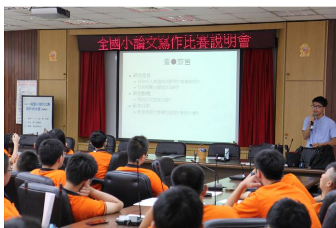
控制科施至舜老師主講