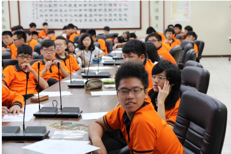
座無虛席，全場認真聆聽