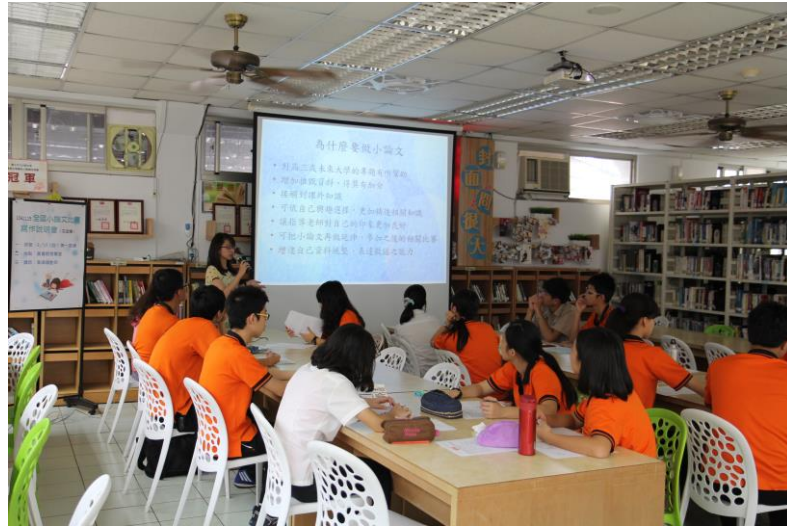
台下認真專注，學習帶得走的能力~