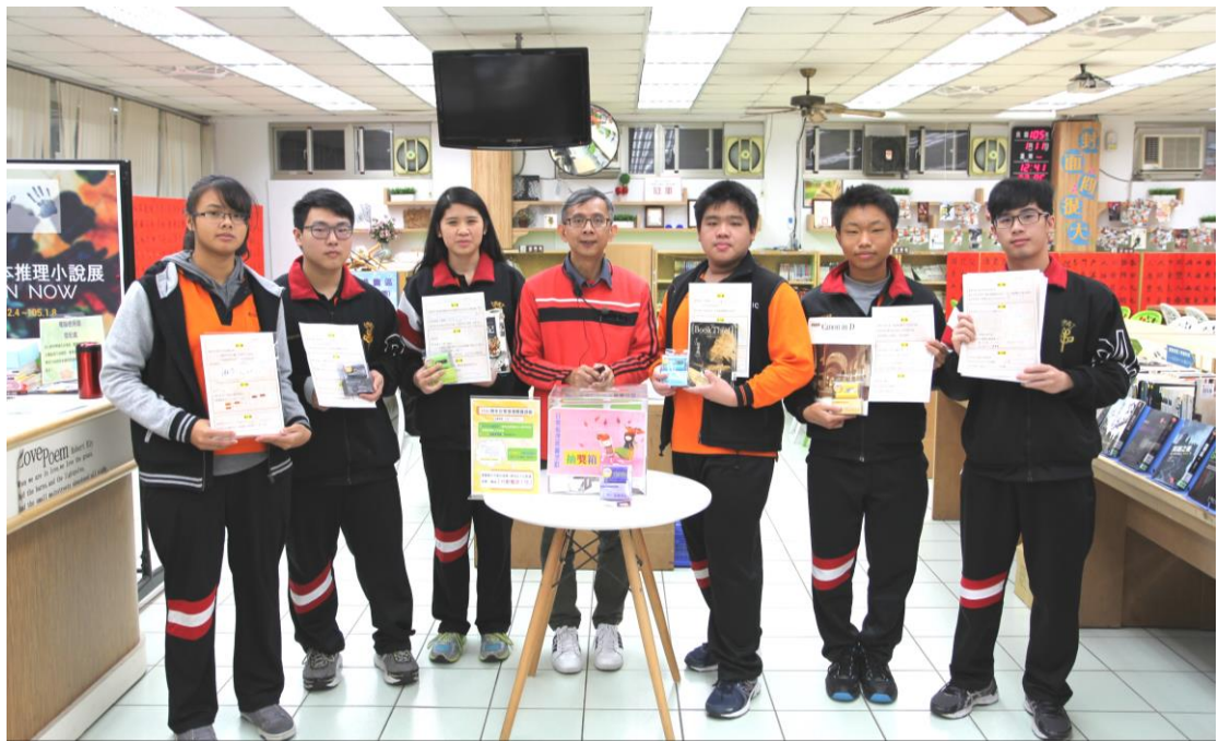
開獎啦～活動圓滿結束！