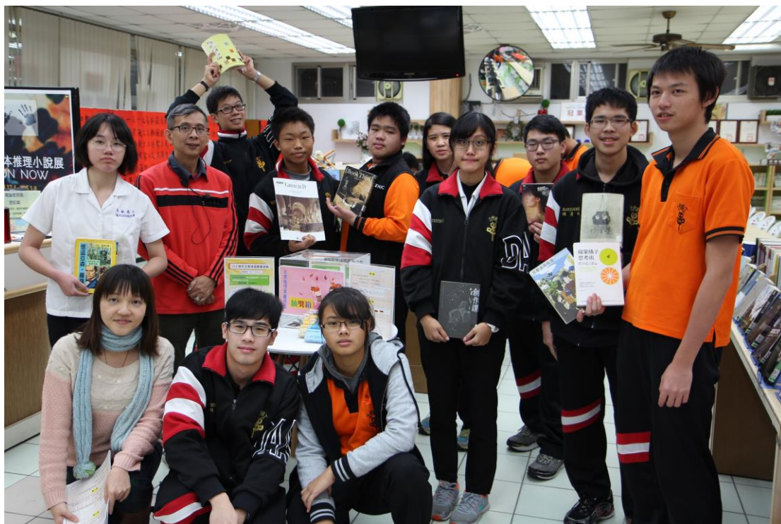
成功解謎的同學，拿著謎底指定書籍開心合照