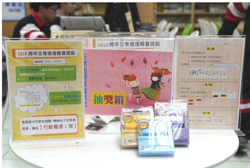
活動宣傳小海報（圖左）、抽獎箱及獎品（中央）、題目板（圖右）

活動說明：配合代言人讀書會「日常推理——崛起的新興推理勢力」及日本小說推理書展，舉辦 1516 跨年日常推理尋寶遊戲。由三位閱讀代言人同學負責出題，每天公布三道題目，同學需依提示解出謎題，進入書庫找到藏在指定書籍中的寶藏卡，解謎成功者可兌換小禮物一份，並獲得參加行動電源抽獎資格。活動期間，幾乎圖書館一開門就有同學前來挑戰，每天第一節下課題目已然「秒殺」，讓同學從解謎遊戲中充分體驗腦力激盪的推理樂趣。