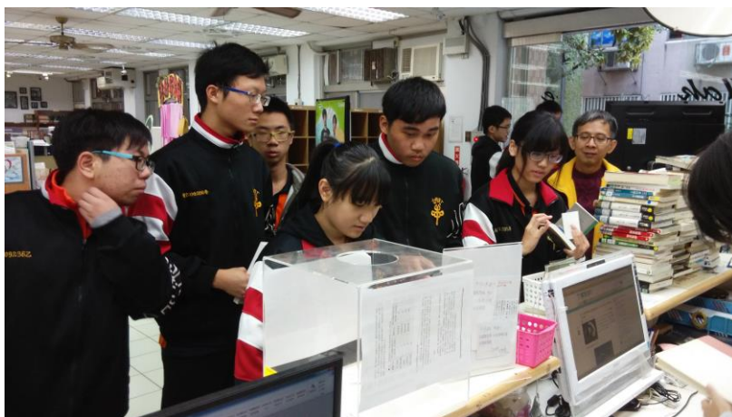
題目公布，同學專心 解謎