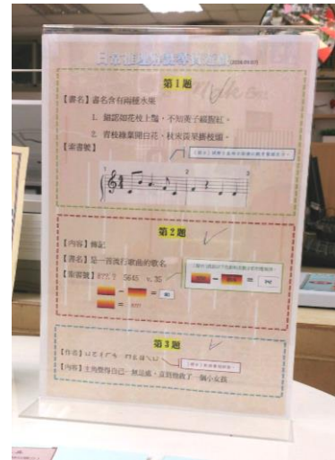
題目板：由三位閱讀代言人負責出題