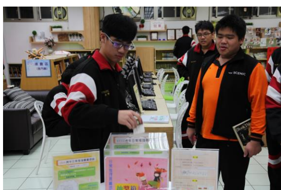
主任及代言人同學抽出行動電源得主