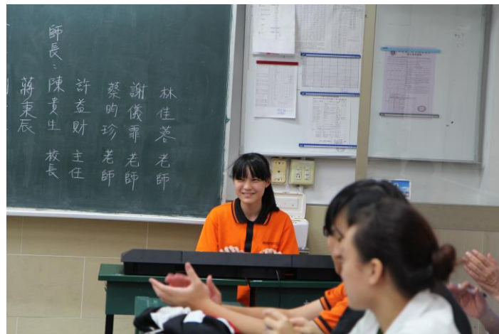
你們緊張嗎？我好緊張喔！那我們先請才藝美少女彈奏一曲，緩和一下氣氛吧！