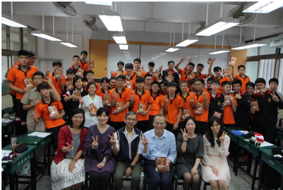
控制一乙《秘密》閱讀分享會，大成功！