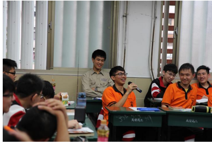
認真閱讀、認真聆聽、認真分享