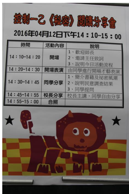
《秘密》閱讀分享會流程

活動說明：全班共讀一本書，可以玩出怎樣的新創意呢？如果邀請校長一同參與，又會擦出怎樣的互動火花呢？4月12日，控制一乙舉辦了一場特別的《秘密》閱讀分享會，邀請校長、圖書館主任以及校內老師與同學們一同閱讀《秘密》這本書。