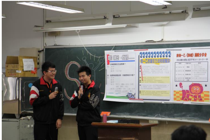
初試啼聲的兩位主持人，完美掌控了 50 分鐘的活動流程