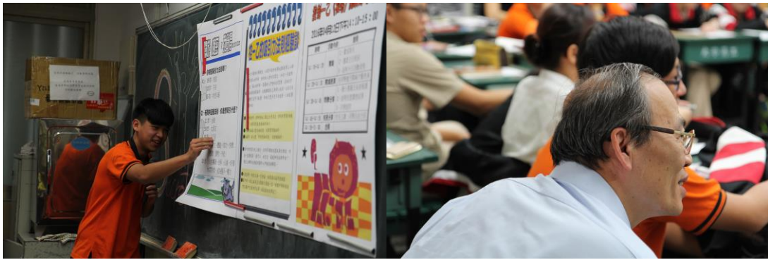
想知道本班的調查結果嗎？讓我來告訴你