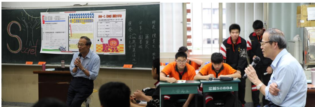
校長分享時間，聽聽他的《秘密》體驗