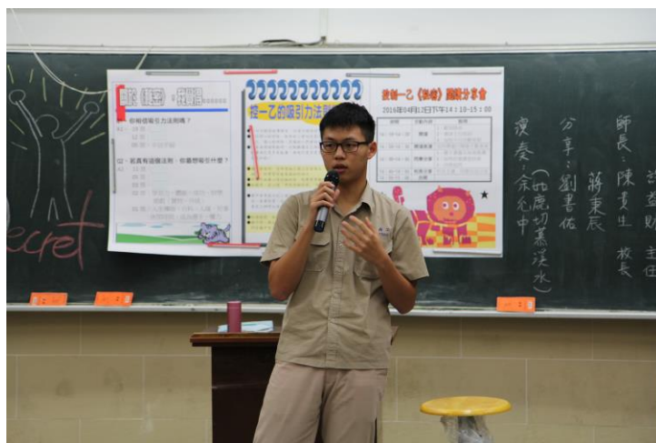
《秘密》是一本怎樣的書呢？讓我來告訴你們