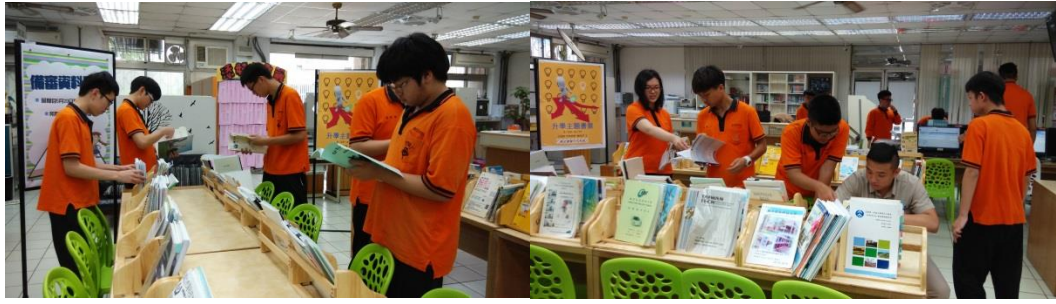
圖書館為高三同學精心準備的書展，幫助想參加甄試的同學一試高中