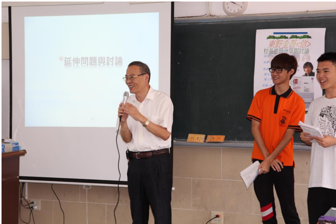
超令人期待的校長分享時間來了～～