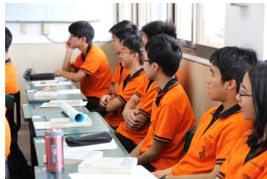
從專注的眼神中，我們確知大家已進入書中世界