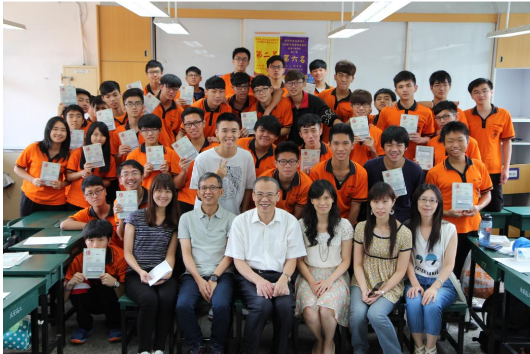
喜歡閱讀嗎？全班一起讀更有趣喔～～