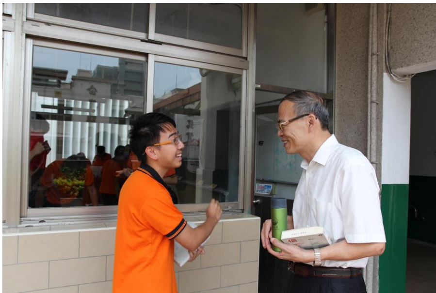
會後小花絮（校長！校長！我還想跟您討論一個問題～～）