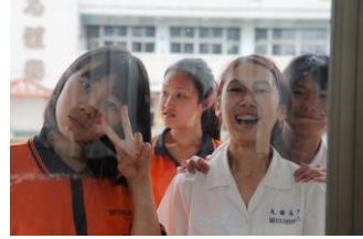
我們聽得認真，窗外路過的別班同學則是羨慕得不得了