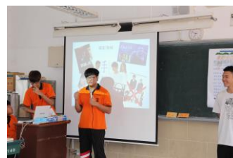
我們都願意上台分享