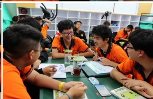
臨時抱佛腳找答案