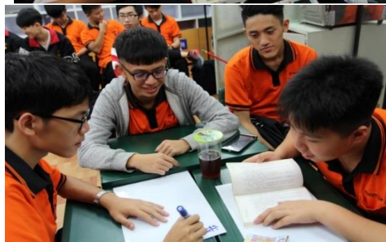
熱烈討論並推派代表發言