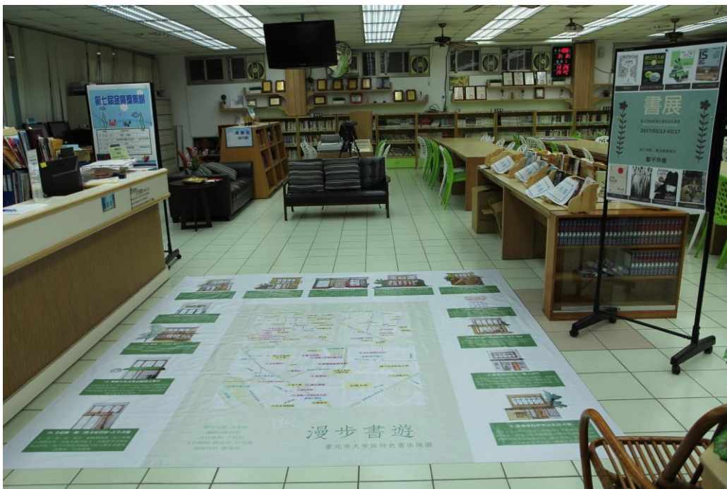
代言人善淳擔任總體設計者，成品展示於閱覽室地面