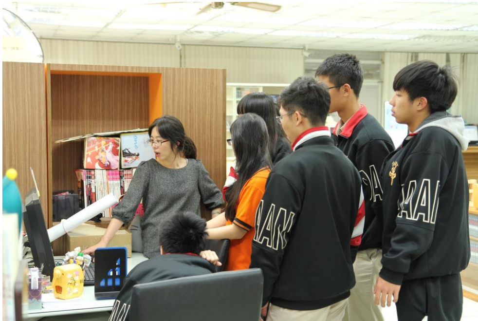
寒假前唯一一次聚會

活動說明：第七屆金質獎設定的主題為「特色書店」。在老師的提議下，代言人們決定要設計一張「臺北市大安區特色書店」的導覽地圖，以大圖輸出的方式，展示在閱覽室的地板上。由於決定要進行這項活動時，已經接近寒假，大家要聚在一起討論非常不容易，故代言人決定要以 LINE 群組討論的方式，在「線上」完成這項工作。這學期開學，代言人們果然如期完成地圖，令圖書館老師們也想為他們大力按個讚！