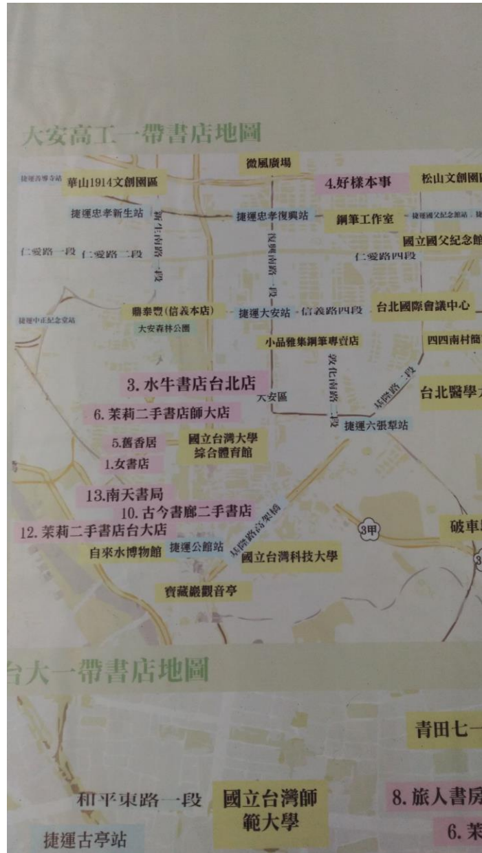
使用 Google 地圖為底，標示大安區特色書店位置，設計者為代言人瑞成和善淳