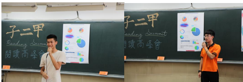
同學們輪流上台報告，分享對書籍內容的看法