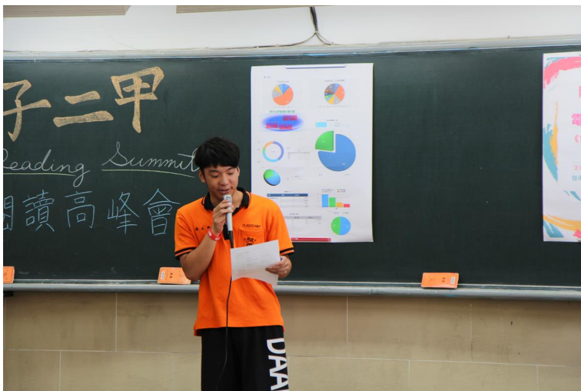
主持的同學幽默風趣，台風穩健