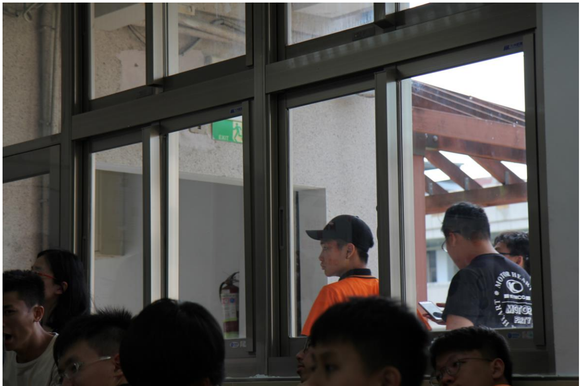
窗外同學充滿好奇